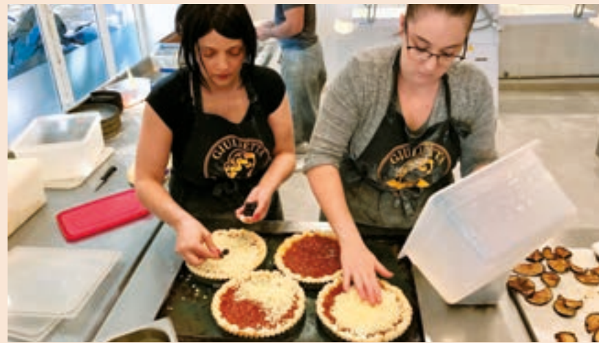
La fameuse tielle sétoise, petite tourte garnie de poulpe en sauce tomate épicée à la base.

Sur l'île singulière, l'art de la table est aussi un art de vivre. Aussi délicieuse que populaire, la gastronomie de Sète et de ses alentours est riche de produits d'exception. Rares sont les villes à pouvoir se vanter d'un tel patrimoine culinaire et les spécialités sont issues pour la plupart des recettes de mammas italiennes venues s'installer dans la ville et la région : macaronade, moules et encornets farcis, bourride de baudroie, seiche à la rouille, coquillages de la lagune de Thau et, bien sûr, la fameuse tielle sétoise. C'est une petite tourte garnie de poulpe en sauce tomate épicée à la base. On la trouve notamment chez Giuletta (Avenue Victor-Hugo 29), maison réputée, qui la recouvre aussi de rosaces d'aubergines frites et la saupoudre de parmesan pour sa spécialité ou la revisite en tielle mozzarella avec des olives noires : un régal. L'autre trésor, ce sont les huîtres et moules de Bouzigues, le petit village en face de Sète, de l'autre côté de l'étang de Thau. Avec des palourdes, escargots de mer, tellines, elles s'épanouissent dans un écosystème privilégié grâce au savoir-faire des