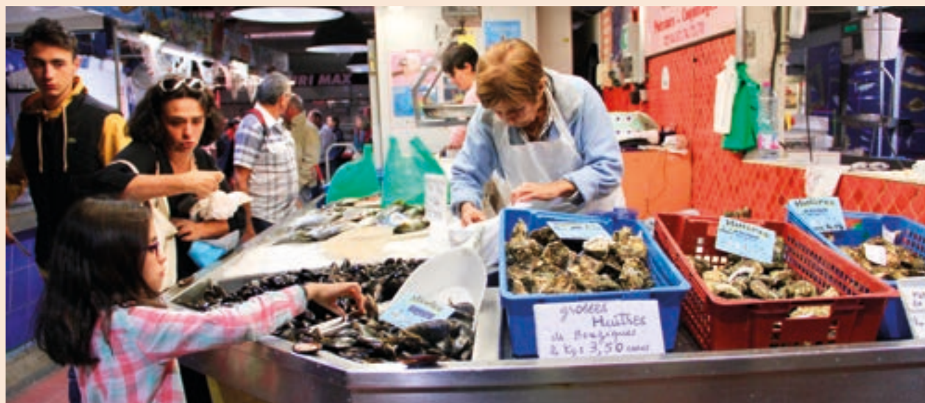
On trouve une pléiade de poissons tous les matins dans les halles centrales et dans des marchés au cœur de la ville.