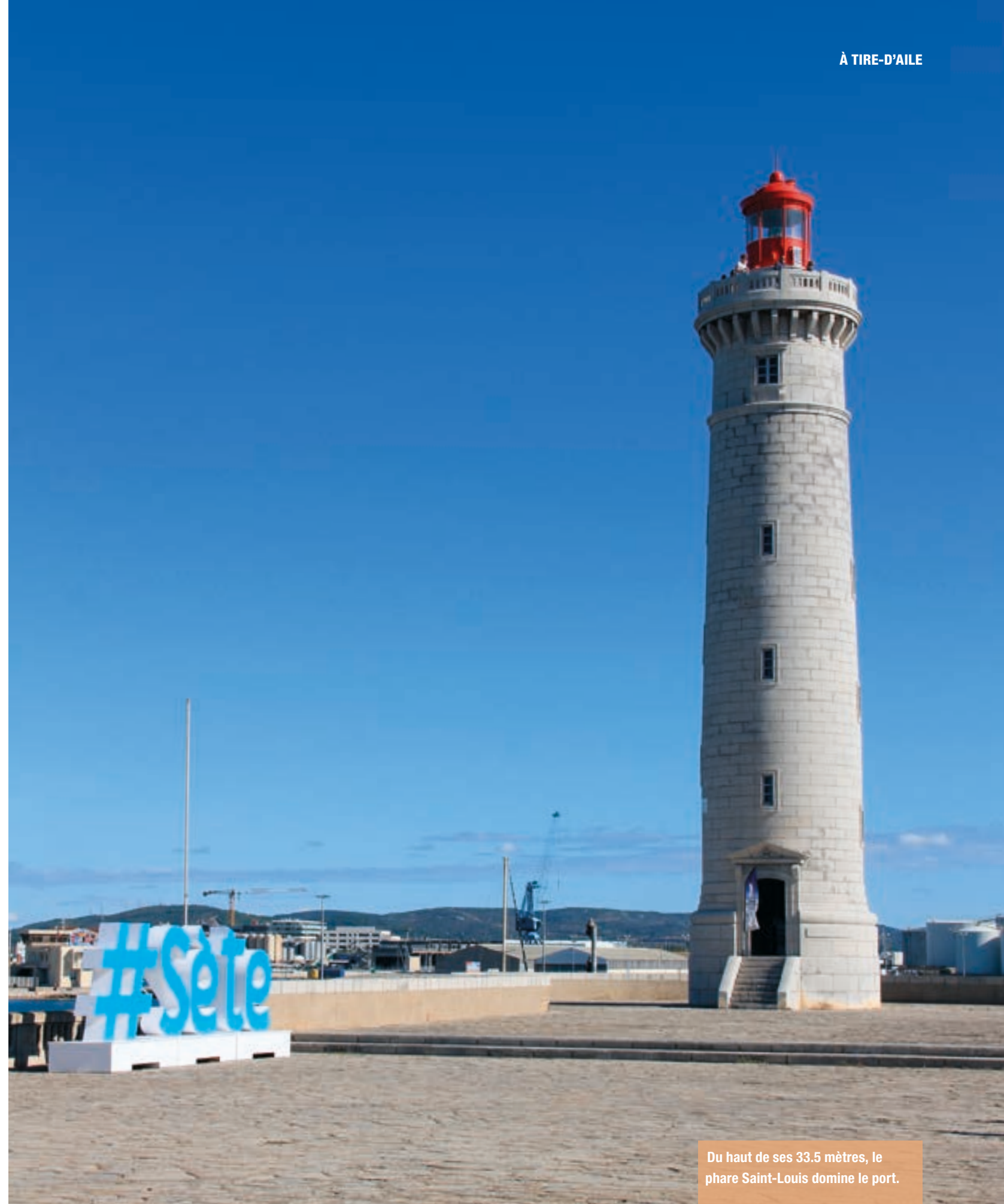
Du haut de ses 33.5 mètres, le phare Saint-Louis domine le port.