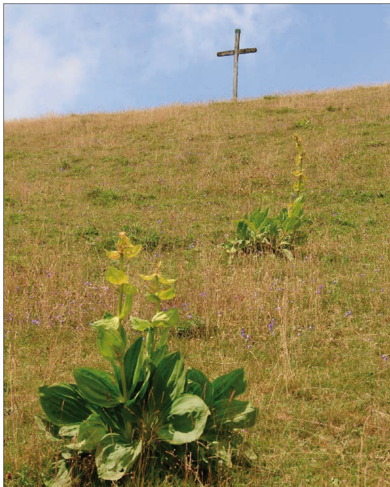
La croix du Suchet sur son antécime, avec, au premier plan, des plantes typiques du massif jurassien: les gentianes jaunes.

Depuis le Suchet, dont la quiétude des lieux est un autre atout, les marcheurs plus aguerris peuvent rallier d'autres sentiers pédestres. Comme celui qui arrive au chalet-restaurant de Grange-Neuve, sur la commune de