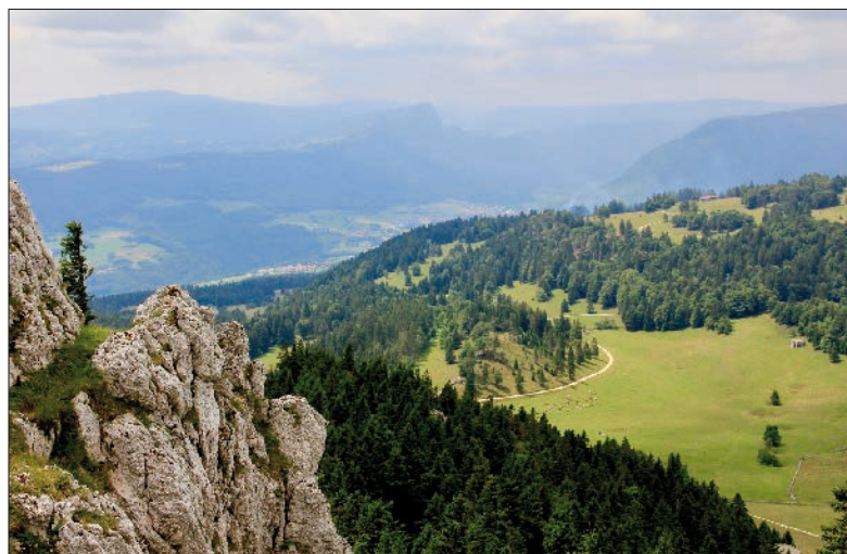
Au fond, la Dent de Vaulion et Vallorbe, sur un autre versant de ce décor de rêve offert par la montagne.