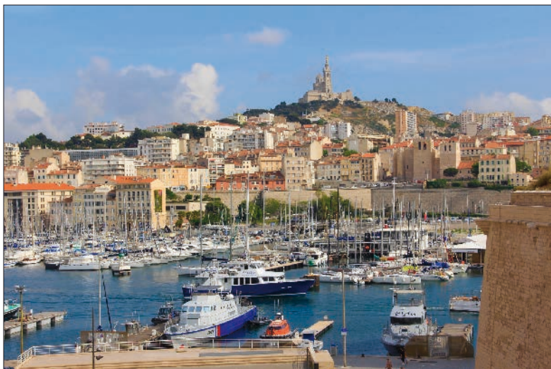
Marseille, son Vieux-Port et la basilique de Notre-Dame de la Garde, d'où il y a une vue panoramique sur la cité.