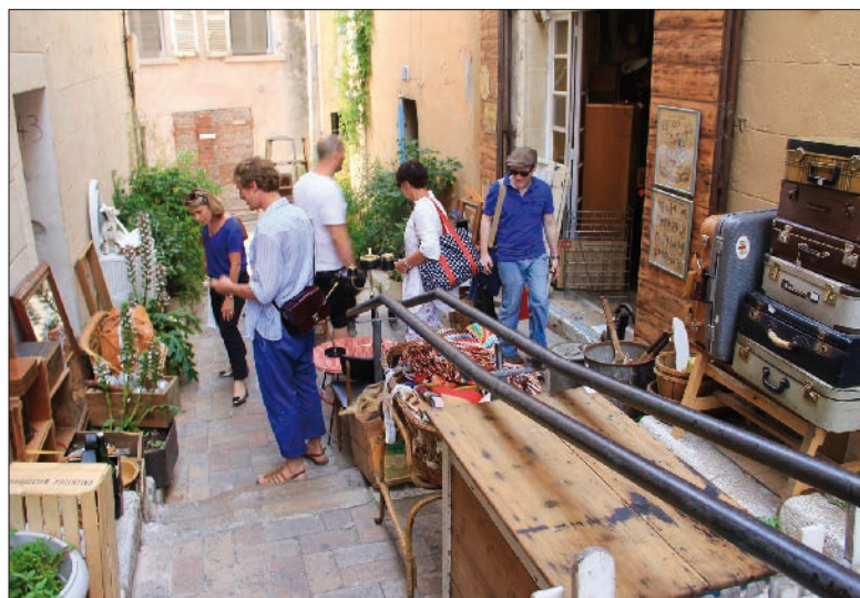
Il fait bon flâner et brocanter dans les vieux quartiers de la Cité phocéenne.