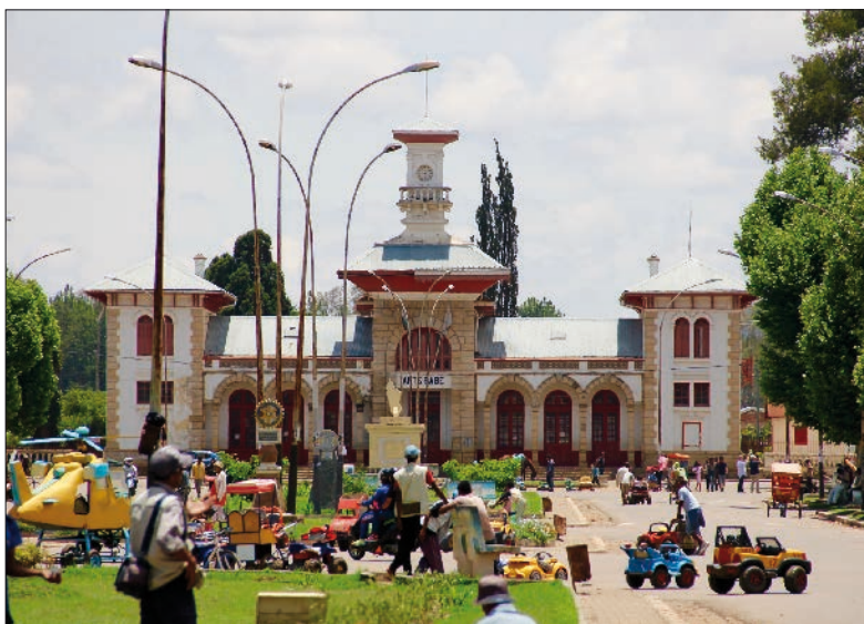
La gare d'Antsirabe est célèbre pour son architecture coloniale.