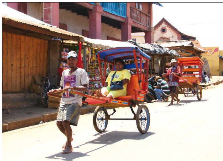
Le pousse-pousse d'Antsirabe est une attraction bien pratique pour visiter la ville.