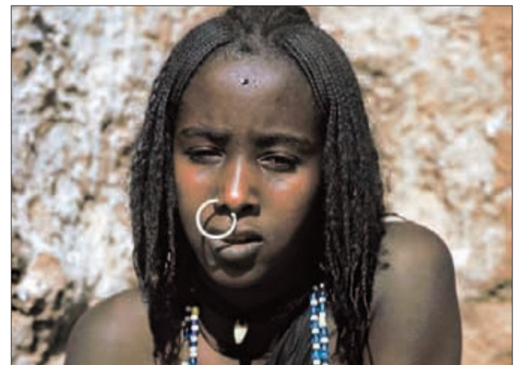
Les archives photographiques de l'Yverdonnois -100 000 clichés- représentent un riche témoignage historique, notamment sur le désert du Sahara, région qui l'a particulièrement fasciné.