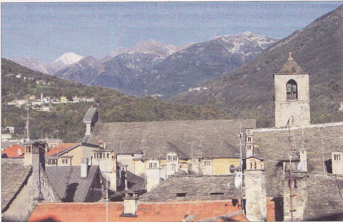
Domodossola a un joli centre historique. En prenant de la hauteur, on peut admirer les toits de pierre.

Son centre médiéval est fascinant, avec notamment une place du marché en forme de trapèze, des ruelles tortueuses ornées de portiques des XIV e et XV e siècles et le palais Silva. Sans oublier l'église San Francesco, d'origine romane et transformée en un palais-musée qui expose des objets originaux, comme le premier aé-