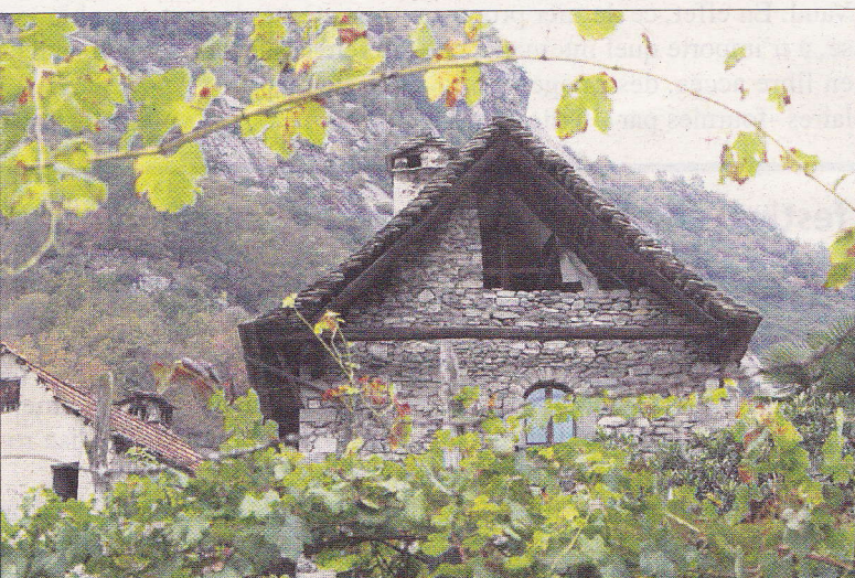
Oira de Crevoladossola, un petit bourg qui allie la beauté à un bon vin et à un succulent fromage du terroir.

Infos utiles: www.distretto-laghi.it/fr et l'Office national italien du tourisme en Suisse: 043 466 40 40, www.enit.ch ou www.enit.it/fr .